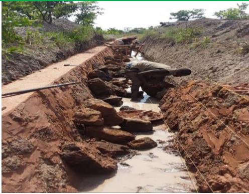
Kazi ya usakafaji wa Sehemu ya Mfereji Mkuu ikiendelea katika skimu ya Gwanumpu iliyopo Kakonko, Kigoma