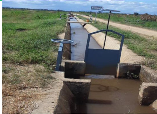
Sehemu Mfereji Mkuu katika skimu ya Mvumi iliyopo Kilosa, Morogoro