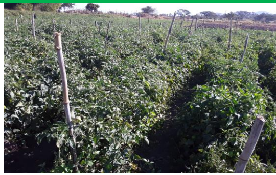
Shamba ya Nyanya katika Skimu ya Lipuli iliyopo Halmashauri ya Wilaya ya Iringa